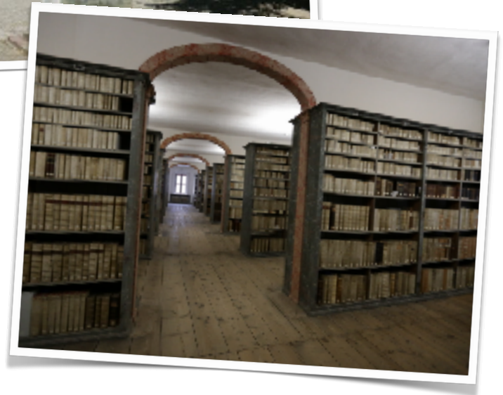
Linsengericht CC BY-SA 3.0