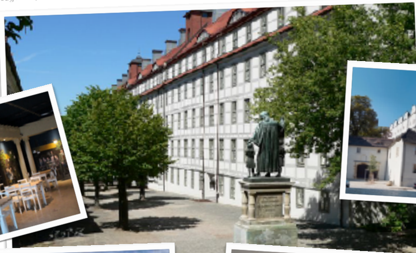
eugen-de, CC BY-SA 3.0