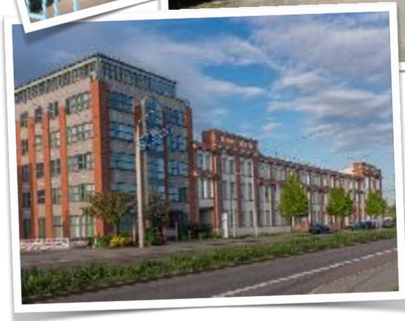
Dauendel CC BY 4.0