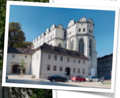
White shark CC BY-SA 3.0